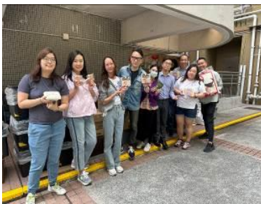
ESG Hong Kong Limited