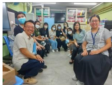
阪急阪神國際貨運(香港)有限公司