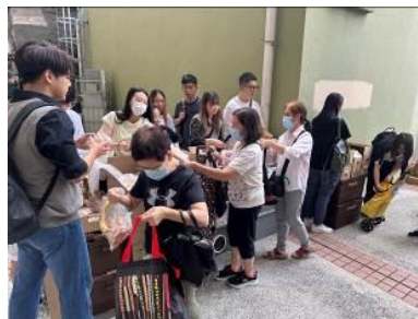
香港中文大學 社會工作學系