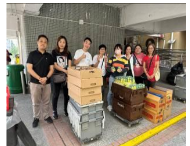
普匯中金國際控股有限公司(Chinlink)